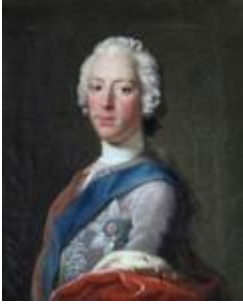
Carlo Edoardo Maria Stuart detto anche Bonnie Prince Charlie (Roma 31.12.1720 – Roma 31.12.1788)