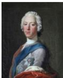
Carlo Edoardo Maria Stuart detto anche Bonnie Prince Charlie (Roma 31.12.1720 – Roma 31.12.1788)