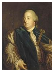
William Augustus duca di Cumberland (26.04.1721 – 31.10.1765)