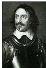
Robert Devereux III conte di Essex, (1591 – 1646)