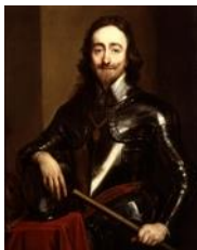
Carlo I Stuart (Dunfermine 1600 – Londra 1649)