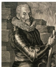
Johann t'Serclaes Graf von Tilly (Villers-la-Ville 1559 – Ingolstadt 30.04.1632)