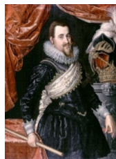
Christian IV (Frederiksberg 12.04.1577 – Copenhagen, 28.02.1648)