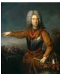
Principe Eugenio di Savoia-Carignano (18.10.1663 – 21.04.1736)