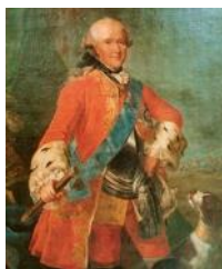
Ferdinand von Braunschweig-Wolfenbüttel (Wolfenbüttel 12.01.1721 – Braunschweig 03.07.1792)