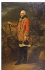
Charles de Rohan-Soubise duc de Rohan-Tohan (Versailles 16.07.1715 – Parigi 01.07.1787)