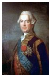
Victor-François de Broglie (Parigi 19.10.1718 – Münster 30.03.1804)