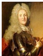
Nicolas de Catinat de La Fauconnerie (Parigi 1637 – St.-Gratien 1712)

Gli ordini di battaglia riportati di seguito sono tratti da le Bouyer de St. Gervais, B. – Memoirs et correspondance du Maréchal de Catinat – 19819, Parigi ma per una migliore giocabilità più avanti (nello scenario alternativo) sono proposti gli stessi ordini di battaglia ma con una maggiore attenzione alla facilità di trasmissione degli ordini. La disposizione delle truppe è esattamente la stessa, solo le posizioni dei generali (e i loro comandi) sono modificate per tener conto dei cambiamenti nella catena di comando. La mappa riportata a pagina 1 si riferisce allo scenario alternativo.