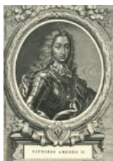
Vittorio Amedeo II Francesco di Savoia (Torino 1666 – Moncalieri 1732)