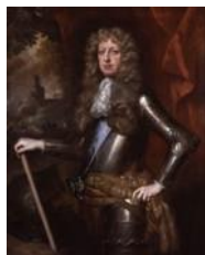
James Butler 1 duca di Ormonde (Ckerkenwell 1610 – Kingdton Lacy 1688)