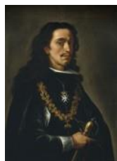
Juan-Josè d'Austria (Madrid 1629 – Madrid 1679)