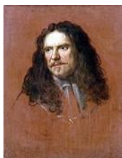
Henri de la Tour d'Auvergne-Bouillon detto il Grand Turenne (Sedan 1611 – Salzbach 1675) ritratto di Charles le Brun