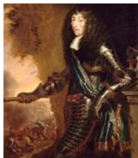
Luigi II di Borbone principe di Condé detto il Grand Condé (Parigi 1621 – Fontainbleau 1686) ritratto di Justus van Egmont