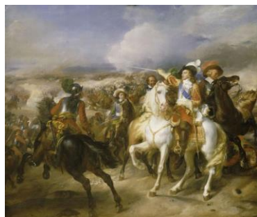
Il principe di Condé alla battaglia di Lens di Jean-Pierre Franque

Le possenti formazioni dei tercios iberici guadagnano ben presto l'iniziativa al centro dello del campo di battaglia, mettendo in grave difficoltà le fanterie nemiche e avanzando verso il cuore dello schieramento nemico. Per fortuna del principe di Condé