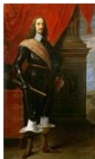
Leopold Wilhelm d'Asburgo arciduca d'Austria (Wiener Neustadt 1614 – Vienna 1662) ritratto di David Teniers d. J.