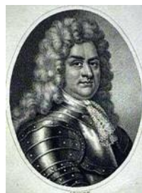
Friederich Hermann von Schomberg (Heidelberg 1615 – Drogheda 11.07.1690)