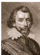
Peter Ernst Graf von Mansfeld (1580 – 1626)