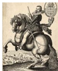
Gonzalo Fernández de Córdoba (1585 – 1635)