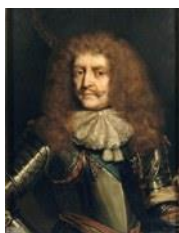
Antoine III Agéonor de Grammont conte de Guiche (Chateau d’Hagetmau 1637 – Bayonne 1673)