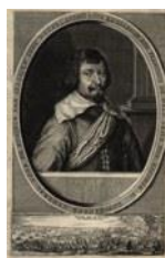
Don Francisco de Melo marchese di Terceira e Tor de Laguna e conte di Assumar (Estremoz 1657 – Madrid 1651)