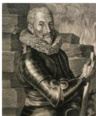
Johann Tserclaes conte di Tilly (1559 – 1632) ritratto di Pieter de Jode II