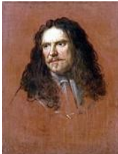
Henri de la Tour d'Auvergne-Bouillon Detto il Grand Turenne (Sedan 1611 – Salzbach 1675) ritratto di Charles le Brun