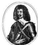
Luigi di Borbone conte di Soissons (Parigi 1604 – Sedan 1641) tratto da Theatrum Europaeum di Matthäus Meridian